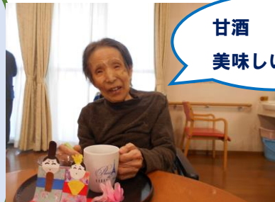
甘酒 美味しいわあ。