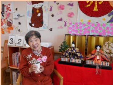
オヤツに桜のゼリーと甘酒をいただきました。