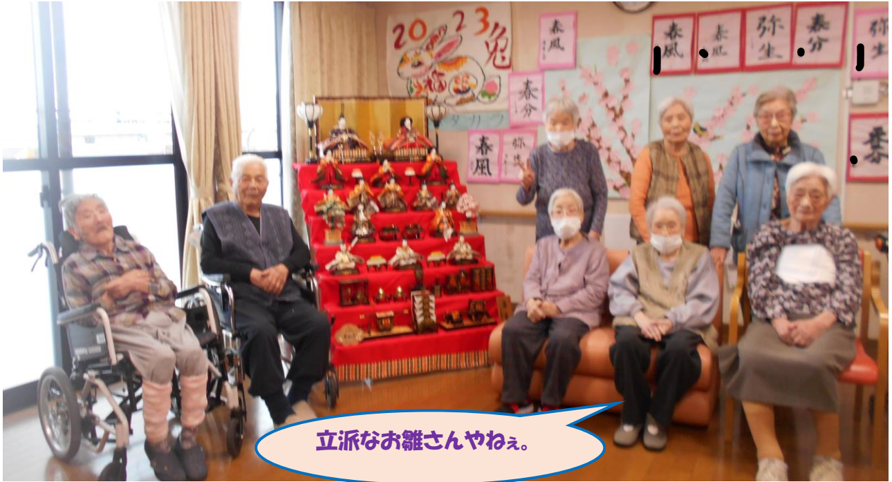
立派なお雛さんやねえ。