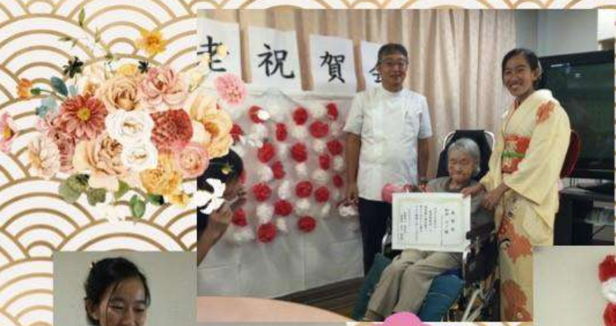
9/13に敬老のお祝いをしました。各フロアの最高齢の方に理事長より賞状の進呈が行われました。今年は101歳の利用者様が3名もおられます♪