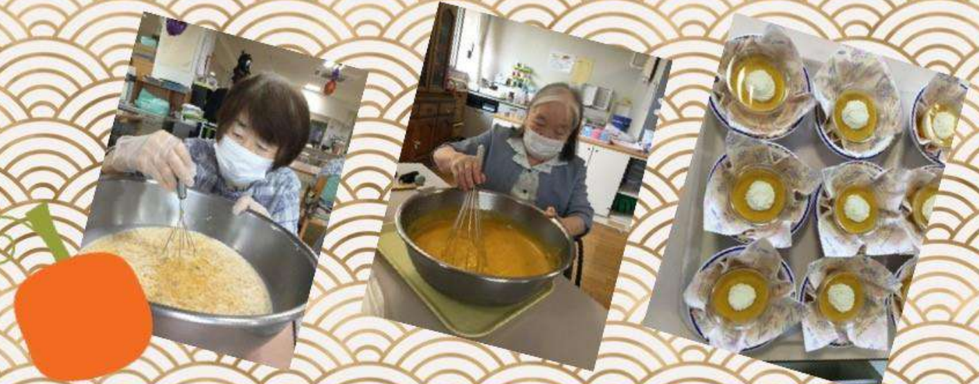
秋らしいおやつを・・・と言う事で、かぼちゃプリンを作りました。