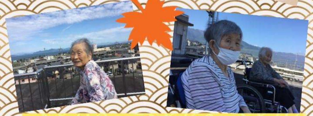
外に出るのが気持ちの良い季節になりました。