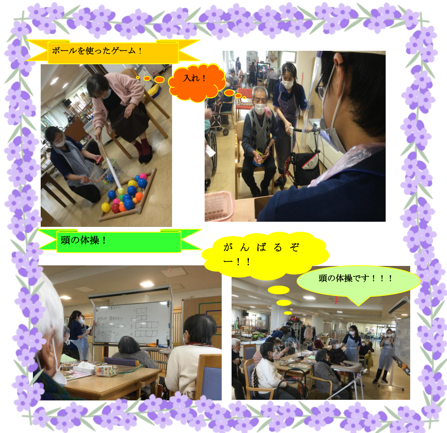
ボールを使ったゲーム！